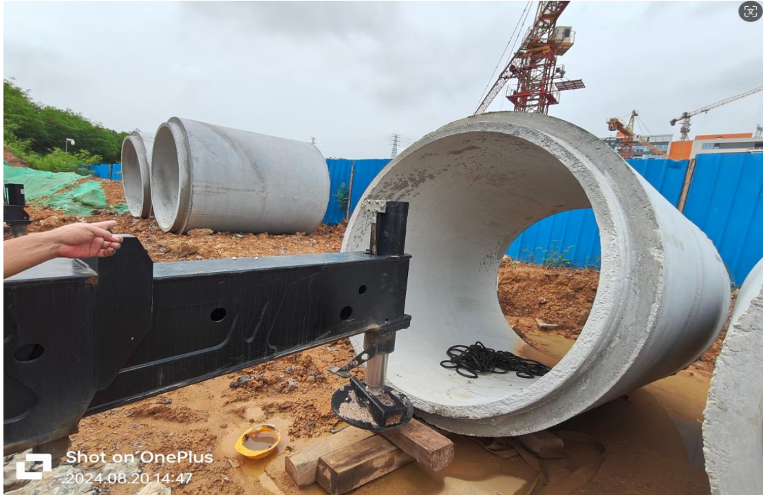
图 2 事故发生位置照片