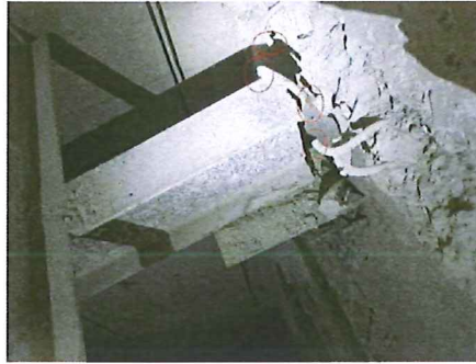
图 4 2 号工字钢钢筋断裂示意图

3.2 号工字钢上有脚印痕迹层，电梯井道四层层门口的地面和铁板上有清晰脚印，该层层门口处未见任何防坠落措施，有磨砂轮 2 个、扳手 1 个、220V 活动插座 1 个。