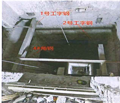
图 2 工字钢与角钢连接示意图