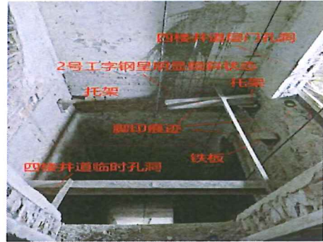
图 3 2 号工字钢状态示意图