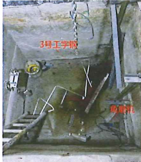
图 5 电梯井道底坑示意图