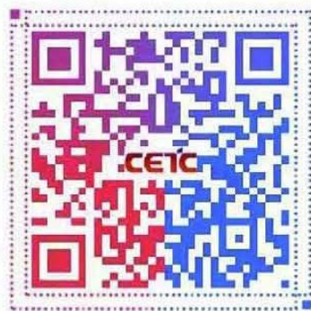
密切接触者测量仪